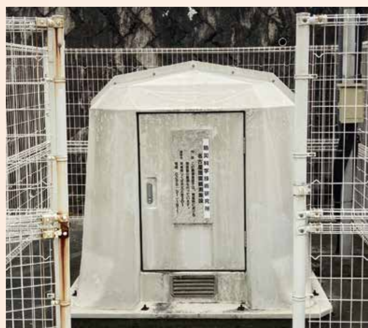
防災科学技術研究所