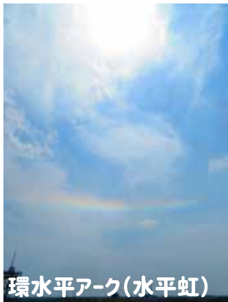
環水平アーク(水平虹)

たか そら けん うん けん そら うん けん せき うん 高い空に巻雲や巻層雲、巻積雲がいるときに会えることがあるよ！