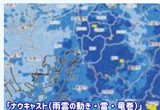
「ドゥキャスト(雨雲の動き・雷・竜巻)」